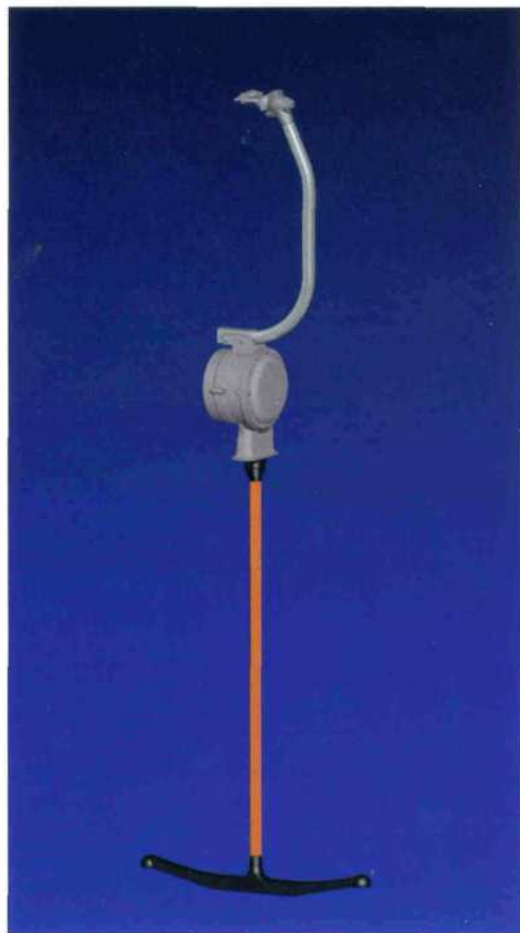
Schleppgehänge LST 260 Hydro